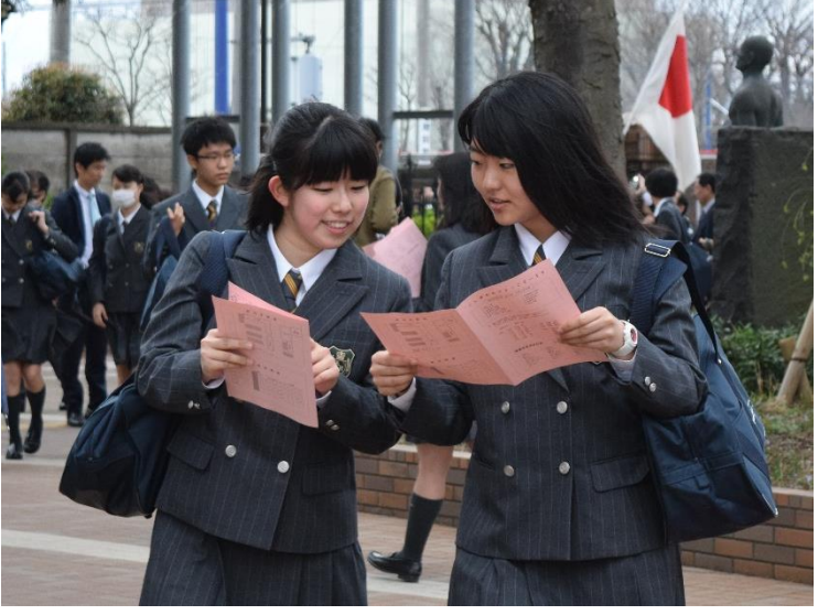
昇降口前で、友達と談笑しながらお互いのクラスのチェックをしあう新入生

優しい花盛りの中、新入生は緊張と期待が入り混じった面持ちで校門をくぐる。校門前の入学式と書かれた看板に、新入生は緊張と期待が入り混じった面持ちで校門をくぐる。校門前の入学式と書かれた看板に、新入生は緊張と期待が入り混じった面持ちで校門をくぐる。