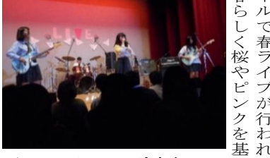
クラスTシャツで演奏をする「teen number」

3月31日(金)に多目的ホールで春ライブが行われた。春らしく桜やピンクを基調としたステージが印象的だった。軽音楽部 年度末も盛り上げの春ライブ