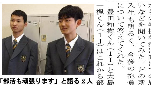
「部活も頑張ります」と語る2人

入学式の後、新入生にこれから学校生活に向けての思いなどを聞いてみた。どの新入生も明るく、今後の抱負について答えてくれた。