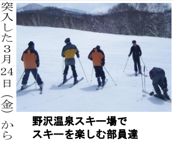
野沢温泉スキー場でスキーを楽しむ部員達

春休み中も部活三昧 スキー同好会 春のスキー合宿 修了式が終わり、春休みにスキー場へ。スキー同好会が合宿を行い、1年生3人、2年生5人、卒業した3年生2人の計10人が参加した。