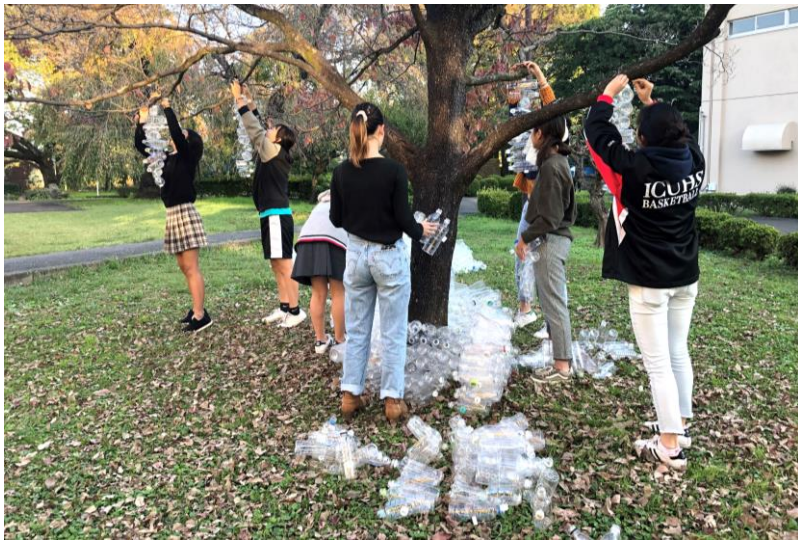
1週間で校内全体から集まったペットボトルを木に吊し、プラごみ問題の現状を訴える

錦城高校では、ペットボトル自販機の設置に向けて現在議論が進んでいる。そこで新聞委員会は、知人のいる都内の高校(公・私立とも)25校にアンケートを行った。質問は、①ペットボトル自販機は学校