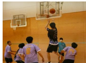
美しくシュートを放つ3G

に沸かせる展開となった。第1ピリオドでは3Gが点差を大きく離して6対0。第2ピリオドでは2Eがスリポイントシュートを2連続で決めて一時的に追いつくが、3Gが再び勝ち越して8対6に。