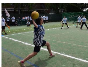
狙いすましてボールを投げる2F

2Fと2Aの試合は終始白熱した闘いを繰り広げた。両者ともに1回ずつゴールを決め、その後も互角の勝負が続く。6回目に入ると2Iがシュートを止められ、ついに3Jがシュートを成功させて勝利を取めた。