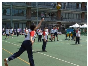
3Cが力いっぱいサーブする

3L対3Cの試合は3Lの連続得点から始まった。その後、3Cも負けじと得点を重ねていくも、なかなか追いつけず、そのまま15対10で3Lが第1セットを獲得した。