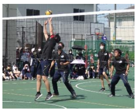
必死にトスを上げる3A

その後も拮抗した試合が繰り広げられ、第1ゲームは15対13で3Aが辛勝した。第2ゲームは序盤、3Aが鋭いサーブで連続得点し、3対0と突き放す。しかし2Fも意地を見せ、5対6と逆転に成功するが、その後は終盤の長いラリー戦を制した3Aが勢いに乗る。鋭いサーブと安定したレシーブで得点を重ね、第2ゲームも制した3Aの勝利に終わった。