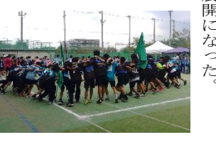
円陣で気合を入れる

つづく第2ピリオドではファウルを取られるシーンが多く、緊迫した静かな試合となっていたが、3Dによるスリポイントシュートに観客が盛り上がった。その得点をきっかけに3Dは怒涛の攻撃を仕掛け、9対2で終了した。最終ピリオドでも3Dの猛攻はやまず、次々とシュートを決め、最終スコアは14対2で試合を終え、3Dは優勝をつかみ取った。