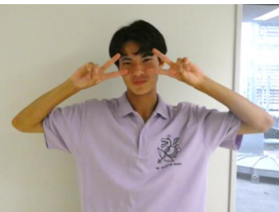
「みんなのことが大好きです♡」

「チームにはセッターとスパイカーがそれぞれ2人ずついて、それも強みだったのだと思います」と話し、最後にクラスメイトへ向けて「大好きです!」と笑顔で感謝の意を伝えた。(歩)