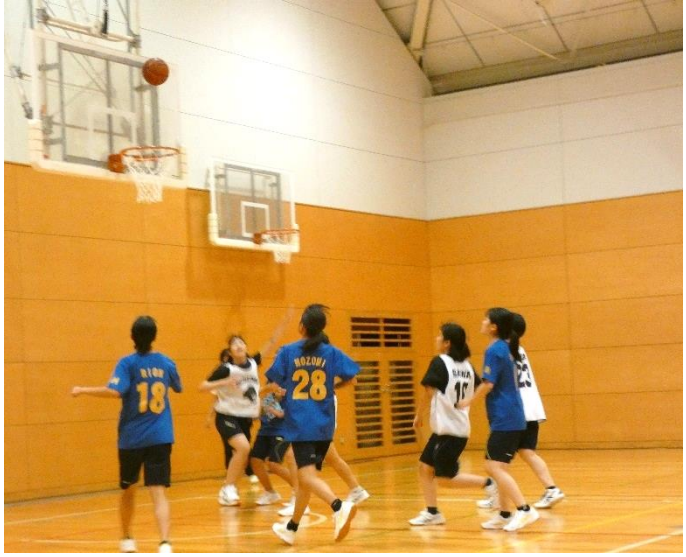
勝敗を分ける運命の1ゴール

第二体育館に、様々なクラスの声援が響く。手に汗握る試合となった女子バスケットボール決勝戦第1ピリオド