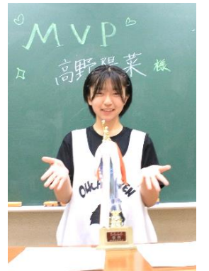
「チームで勝ち取ったトロフィーです」

クラスメイトへのメッセージを聞くと「一緒に戦ってくれた人は、全力で走って、シュートしてくれてありがとうございますと言いたいです。自分たちの試合がほかの種目と被っていることが多く、決勝の応援が一番大きく、盛り上がっていたので、びっくりしました。力にもなったし、ありがたかったです」と話してくれた。(白)