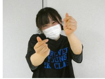
2Kのみんなに愛を伝える

最後に「サッカーでの優勝、総合優勝など、すべてクラスみんなのおかげです。本当にありがとうございます」と感謝の言葉で締めくくった。(香)