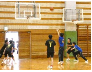
栄光目指してシュート！

3D対1Hの決戦は、多くの観客が見守る中で始まった。開始直後、3Dが敵陣に攻め入り、2点を先制。しかしすぐに1Hが2点を返す。しかし、3Dがフリースローで得点。第1ピリオドは3対2となった。