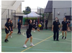
得点目指してボールをつなぐ

女子バレーボールの決勝は3K対3Bとなった。第1セット序盤は一進一退の攻防が続く。そんな中、3Bが流れに乗ってリードを奪う。しかし、負けじと3Kも食らいつき、声掛けから流れをつかんで試合は同点に。その後3Kは点を連取。第1セットは3Kが獲得した。