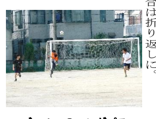
ゴールへのロングパス

サッカー 試合は2Kのキックオフでスタート。攻防が続く中、2Kがスローインからヘディングで初得点。そしてロングシュートを試みるも、失敗。2Kは追加点を狙ったが、3Mに阻まれた。この後も2Kの攻撃は続くが、3Mが守り切り、試合は折り返しに。