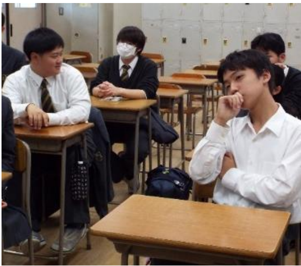
慎重に回答する候補者たち