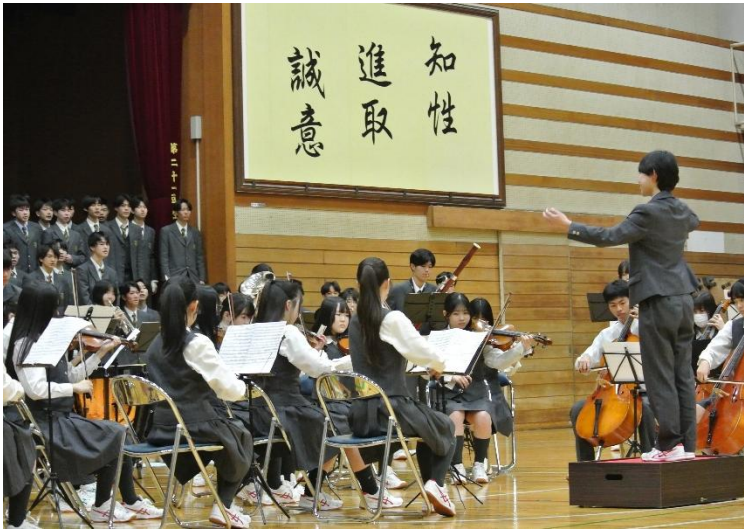
オーケストラのハレルヤで一年生をお出迎え

4月9日(木)に行われた新入生歓迎会。入学したばかりの64回生をハレルヤ合唱や部活動が歓迎した。その様子をお伝えする。