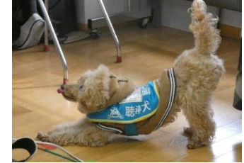
お仕事終わりで一息