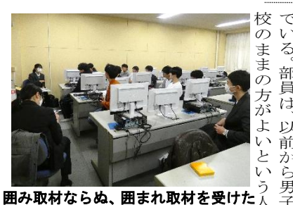
困り取材ならぬ、困られ取材を受けた

一般紙と差別化するために、校内の出来事や川越に関する記事をメインに作成しているという。川越高校新聞の特徴の一つとして挙げられたのが、「川越高校新聞」で印象に残った特集は、備蓄米やコメ不足について、JAやコメ販売店、近くのスーパーなどに取材したものだそう。このように学校新聞の良さを生かし、