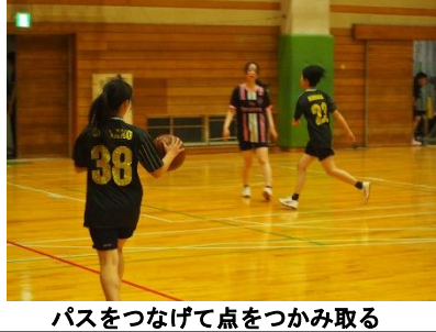
パスをつなげて点をつかみ取る

女子バスケットボールの3G対3Hの試合、1ピリオドではお互い激しい攻防が続いたが、0対0で点数は不動。2ピリオドでは、3Gが3ポイントを3連続で決める展開が起き0対9で終了。3ピリオドでは、3Hがシュートを決め2対9と追い上げようとするも3Gのがゴール下のシュートを決め2対11で3Gが制して試合が終了した。