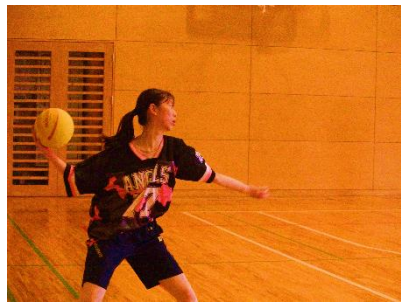
狙いを定めて渾身の一撃

ドッジボールの2C対1Mの試合は生徒の応援で盛り上がった。2Cからの攻撃で1Mの1人が当たるも空中で別の生徒が取ったことでセーフとなり会場は大盛り上がりとなった。最後に1人だけ残った1Mを四方向から追い詰めた2Cの勝ちで1セット目が終了。2セット目ではさらに白熱した。1Mは小さく動き2Cを翻弄するも、先輩の意地を見せた2Cが勝利した。