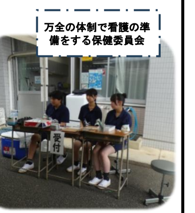
万全の体制で看護の準備をする保健委員会