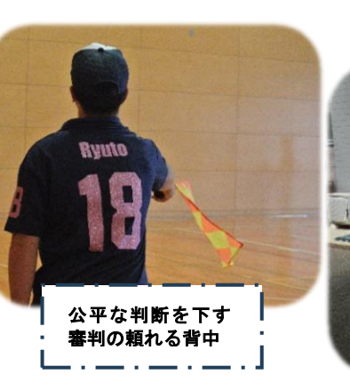
公平な判断を下す審判の頼れる背中