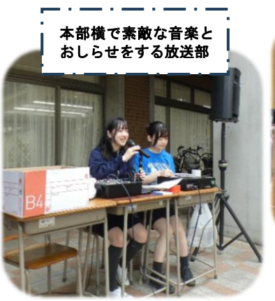
本部横で素敵な音楽とお知らせをする放送部