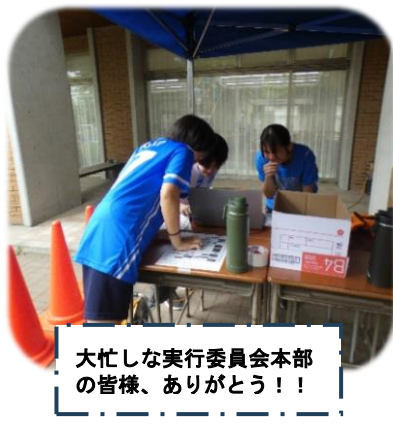
大忙しな実行委員会本部の皆様、ありがとう!!