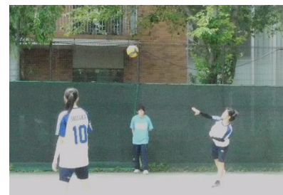
一点集中、丁寧なサーブ

白熱したラリーを繰り広げた女子バレーボール、3C対2C。序盤は2Cが連続でサーブを決めリードしたが、3Cも負けずに粘り強くボールを繋ぎ徐々に得点を重ねた。そして、15対12で第1セットは3Cが制した。第2セットも激しい攻防が起こり両者譲らなかつたが、後半に3Cが差を広げ15対10で3Cが制し、勝利した。