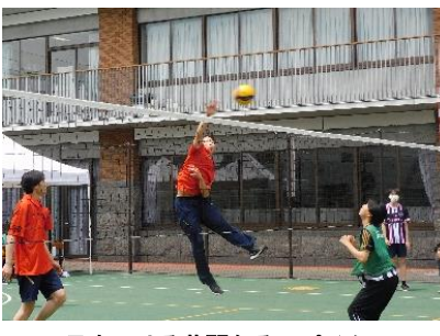
目をみはる華麗なるスパイク

男子バスケットボール1A対1Jの試合では体を張ってボールを奪い合う様子が見られた。1ピリオドではお互いに点を決め2対2の同点。第二ピリオドも双方チームの連携によりスリーポイントシュートを取り7対7。第3ピリオドは白熱が続いた。1Aがゴール下でシュートを決め、終盤には1Aはチームのパスの連携がスリーポイントを決め、12対7で1Aが勝利した。