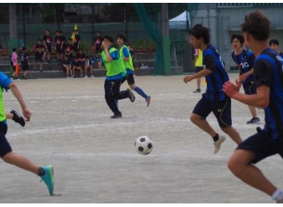
光り輝くファインプレー

サッカー1C対1Gの試合は1Gのボールからスタートした。パスが繋がれていく隙をつき、1Cがパスをカット。そのまま先制点を飾った。1Gも負けじと攻め、シュートを放つ。1Cはゴールを守り抜き、追加点を獲得した。後半では、両者ともロングパスを生かした、速攻が多く見られた。激しい攻めの中でも、ゴールを守り抜き1Cが2対0で勝利した。