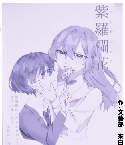
紫羅欄花最終回に寄せて、文藝部の来白さんに挿絵を描いていただいた

文藝部とのコラボ企画『紫羅欄花』連載最終回。本企画は、文藝部悠有志の皆さんが、毎号書き手を替えて話を紡いでいくリレー小説。ぜひ楽しんでほしい。(前回までのあらすじ) 高校生の『僕』は自称幽霊にUFOに乗せられ、カレールームに飛ばされた。 * * *