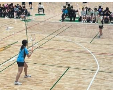
関東大会予選の様子

4月26日(日)に駒澤オリンピック公園屋内競技場で行われた高校バドミントン春季大会兼関東大会予選で、バドミントン部が東京都女子団体7位に入賞した。この結果、6月5日から7日に京王アリーナで行われる関東大会に出場を決めた。