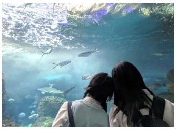
水族館で癒される