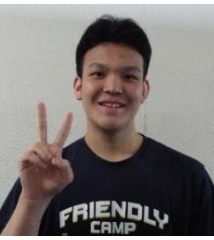
チームメイトに感謝を述べる

男子バスケットボール部は、今年の4月29日(水)に行われた東京都高等学校男子バスケットボール春季大会兼関東大会東京都予選でベスト32になった。