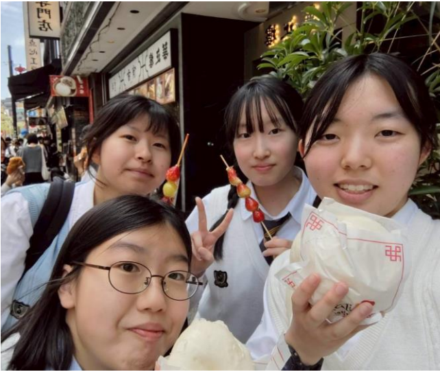
横浜の中華街で名物をいただく

横浜エリアでは、元町中華街で多くの錦城生や観光客が食べ歩きを楽しんでいた。自分の顔くらい大きさの大鶏排と呼ばれる平たい唐揚げは、あまりの大きさに食べられるの不安になった。可愛いわい目で大人気のパンダまん。ノーマルのパンダまん