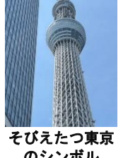
そびえたつ東京のシンボル

東京スカイツリーの下には、東京ソラマチというショッピング施設がある。東京スカイツリーのグッズが販売されていた。また、東京ソラマチにもカフェやレストランがあり充実していた。