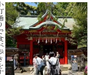
江ノ島神社に参拝

のほかに、激辛パンダまんやいちごパンダまんなどの変わり種があり、計6種類ある。それぞれの味によって色や見た目が異なっていて、とても可愛かった。